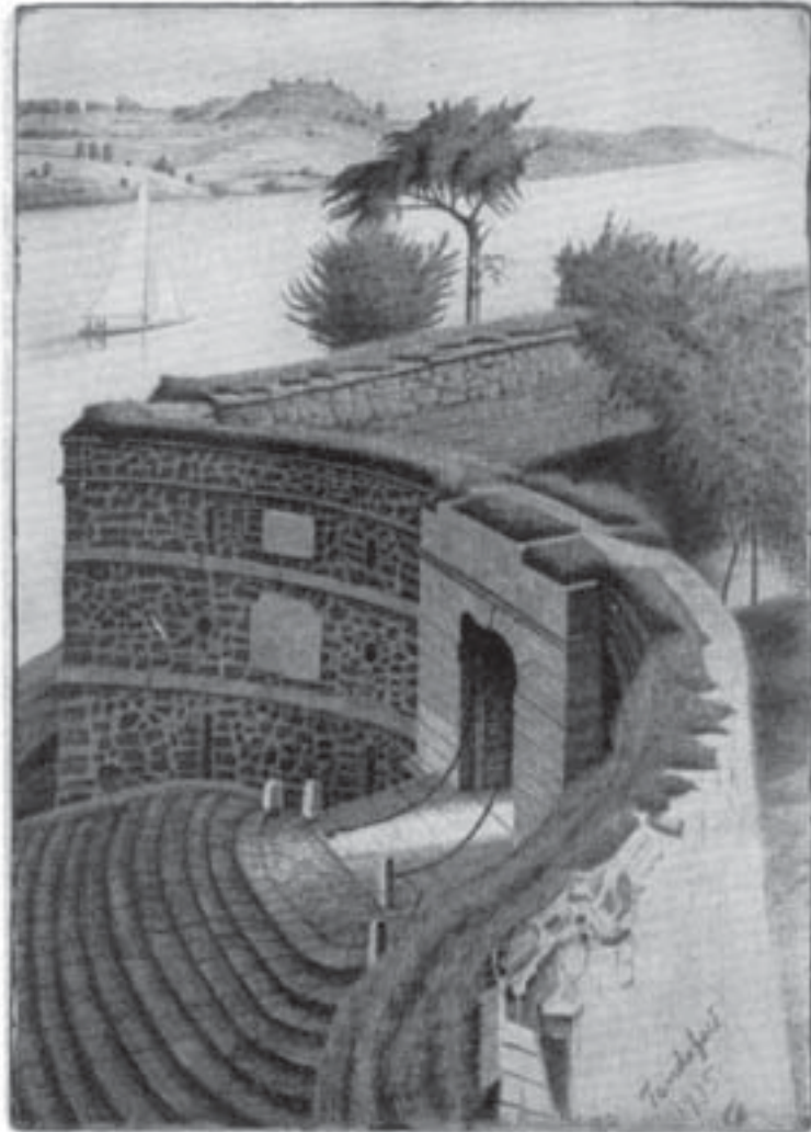
Kungsporten, en del av sjöfästningen Sveaborg utanför Helsingfors. Henrik Tandefelt 1935